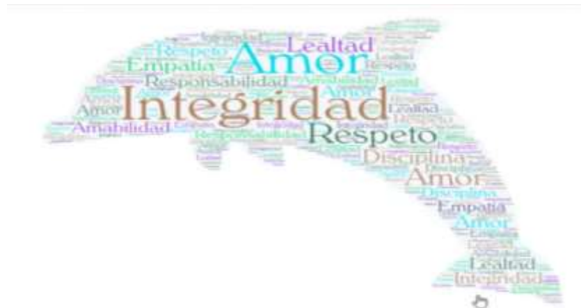
Figura 1 Representación del significado del valor integridad por un estudiante

Analizan los ejemplos que se presentan de integridad, lo contextualizan y ponen otros ejemplos donde se presentan estos comportamientos y hacen una crítica a esos comportamientos, enfatizan el valor integridad como un conjunto de valores que nos hacen ser mejor persona. Comparten ejemplos de integridad y acciones que hacen que una persona no sea íntegra, se poseionan como estudiantes íntegros y en ocasiones los adultos no respetan y se pierden la integridad, otro ejemplo es que: “piden respeto y no lo dan”, un alumno que llega tarde por dormir tarde y lo expresa a su profesor y este lo entiende. Al cierre plasman a través de imágenes y palabras el significado que le ha dejado el valor integridad. Seleccionaron imágenes como el delfín, mascota que representa la institución, así como búhos, pájaros, entre otros, plasmaron palabras como lealtad, respeto, compromiso, honestidad, integridad, amor, disciplina, empatía, amabilidad.