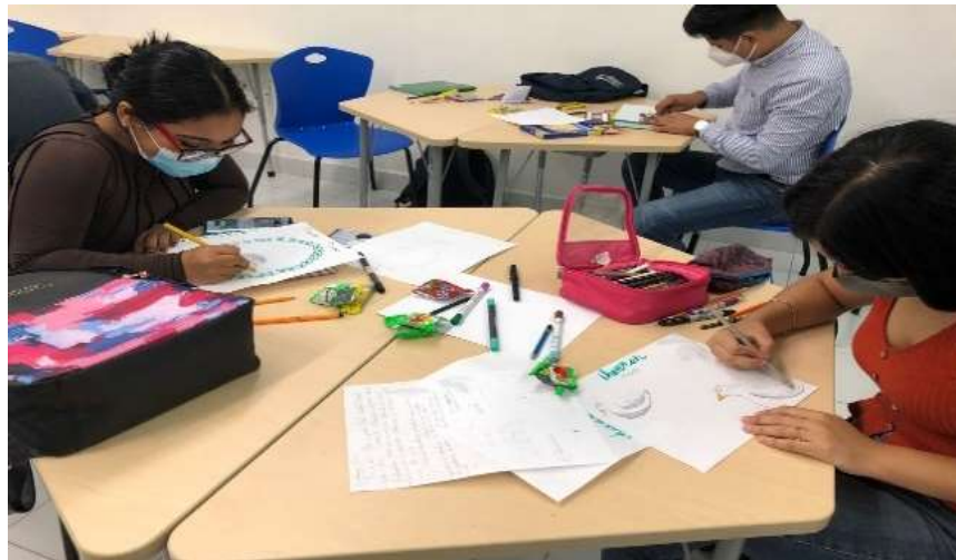
Figura 2 Estudiantes dibujando y creando mensajes de conservación, valor profesionalismo

En la tabla 6 se presentan las acciones y propósito para observar la incidencia del valor equidad en los participantes.